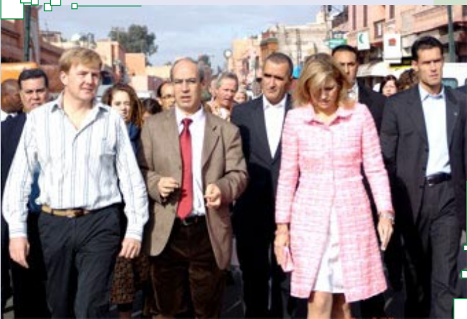
De droite à gauche : la Princesse Maxima, Fouad Abdelmoumni, et le prince de Hollande