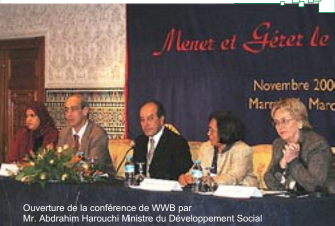
Ouverture de la conférence de WWB par Mr. Abdrahim Harouchi Ministre du Développement Social